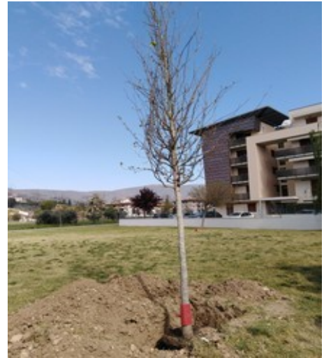
IMMAGINE 3: Iniziativa PIANTIAMOLO! Dona il tuo albero per Calenzano.

Piantiamolo! Il tuo albero per Calenzano