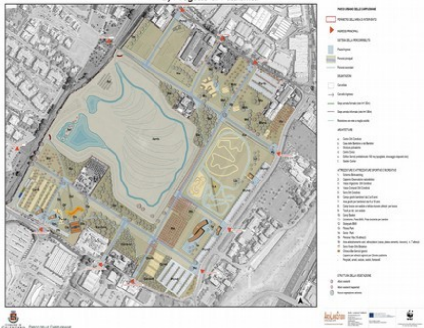
IMMAGINE 4: Progetto il Parco delle Carpugnane.