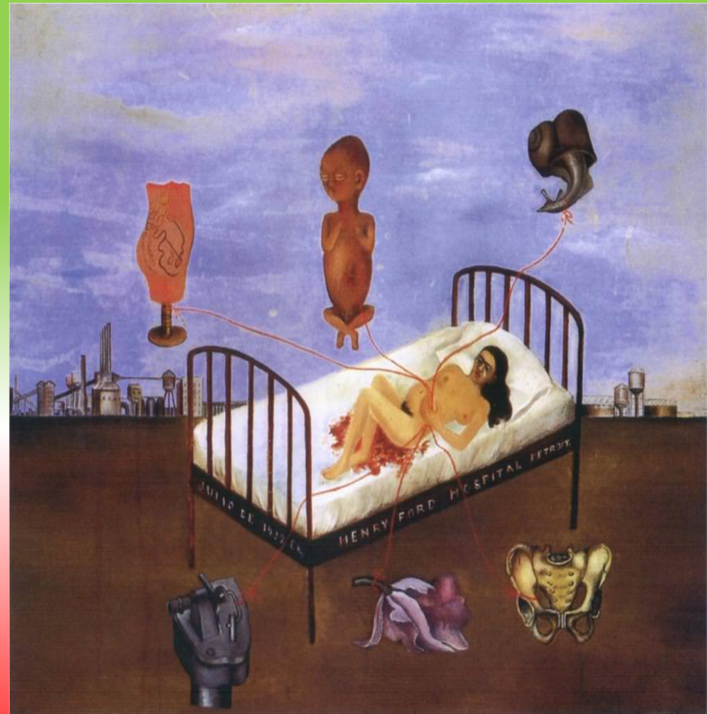
Ospedale Henry Ford (Letto volante), 1932