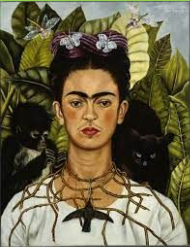
Autoritratto con collana di spine, 1940