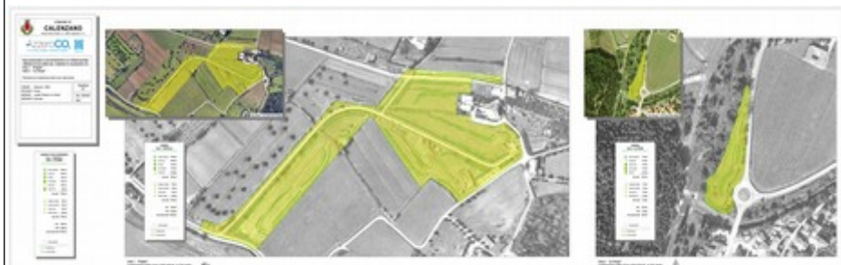
IMMAGINE 3: Iniziativa PIANTIAMOLO! Dona il tuo albero per Calenzano.